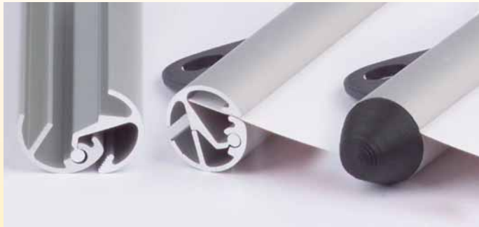
Abbildung in Originalgröße (Durchmesser der geschlossenen Leiste 16mm) Eingetragen im deutschen Patentamt unter dem Aktenzeichen 4 04 06 610.0